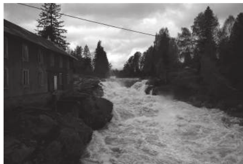
Ommesfoss i Hjartdal kommune (Skiensvassdraget), mai 2010

20 I Noreg har vi observert vassføring i mange elver i fleire tiår. Ei analyse av slike data viser at vårflaumen i Noreg kjem stadig tidlegare. Det er fordi temperaturen har auka og snøsmeltinga startar tidlegare. Sannsynet for dramatiske hendingar vil auke. I områder der den største flaumen i året i dag er ein regnflaum, vil flaumane bli større. Vi ventar oss dessutan fleire ekstreme nedbørepisodar med mykje regn på kort tid. Då får vi fleire lokale, store regnflaumar. Små bratte bekker og elver og urbane område vil vere spesielt utsett. Men, det er òg slik at snøsmelteflaumane i dei store vassdraga vil bli mindre, rett og slett av di det blir mindre snø.